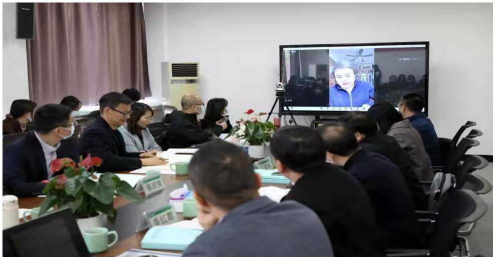
张梓太教授作主题报告

中国法学会环境资源保护法研究会副会长、最高人民法院环境资源审判咨询专家、复旦大学环境资源与能源法研究中心主任张梓太教授作《中国生态法治本土进路分析》的主题报告。张梓太教授指出由于自然规律因地制宜，自然禀赋因地制宜，中国的环境问题也与其他国家不同，且我国生态立法具有本土道路的历史性，中国的生态环境法治研究要站在特殊性与具体性的角度去探究其本土化进路。当下，在人类面临严峻的生态环境问题的大背景下，如何发掘与展现东方文明下生命模式的优越性是值得各位学者讨论与实践的。