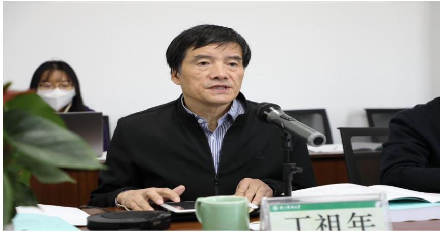
丁祖年主任作主题报告

中国法学会环境资源保护法研究会副会长、最高人民法院环境资源审判咨询专家、复旦大学环境资源与能源法研究中心主任张梓太教授作《中国生态法治本土进路分析》的主题报告。张梓太教授指出由于自然规律因地制宜，自然禀赋因地制宜，中国的环境问题也与其他国家不同，且我国生态立法具有本土道路的历史性，中国的生态环境法治研究要站在特殊性与具体性的角度去探究其本土化进路。当下，在人类面临严峻的生态环境问题的大背景下，如何发掘与展现东方文明下生命模式的优越性是值得各位学者讨论与实践的。